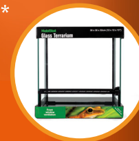
Glass Terrarium 30 x 30 x 32cm