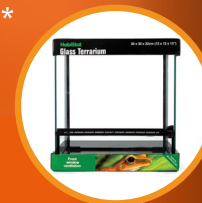
Glass Terrarium 30 x 30 x 32cm