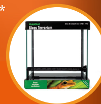
Glass Terrarium 30 x 30 x 32cm