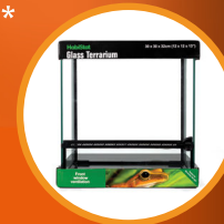
Glass Terrarium 30 x 30 x 32cm