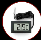
Digital Compact Thermometer