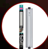
Pro T5 UVB Kit 6% UVB, 24W