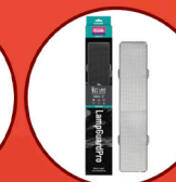
Lamp Guard Pro