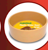
Round Plastic Water Bowl