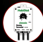
Dimming Thermostat 600W