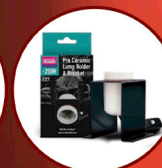
Ceramic Lamp Holder Plus Bracket Pro