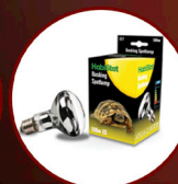
Basking Spotlamp 100W