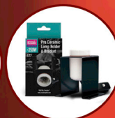
Ceramic Lamp Holder Plus Bracket Pro