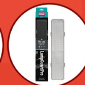
Lamp Guard Pro