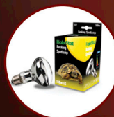
Basking Spotlamp 100W