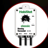
Dimming Thermostat 600W