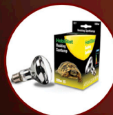
Basking Spotlamp 100W