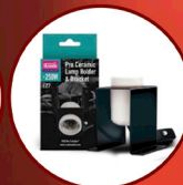
Ceramic Lamp Holder Plus Bracket Pro