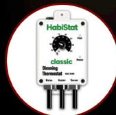
Dimming Thermostat 600W