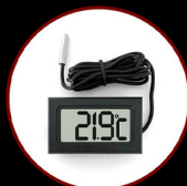
Digital Compact Thermometer