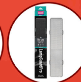
Lamp Guard Pro