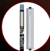
Pro T5 UVB Kit 6% UVB, 24W