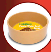
Round Plastic Water Bowl