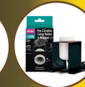
Pro Ceramic Lampholder and Bracket