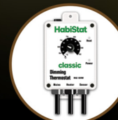
Dimming Thermostat 600W