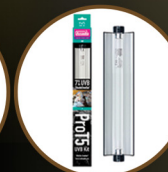
Pro T5 UVB Kit, 7% UVB ShadeDweller, 8W