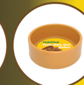
Round Plastic Water Bowl