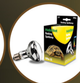
Basking Spotlamp 100W