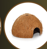
Coconut Cave x2