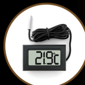
Digital Compact Thermometer