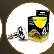
Basking Spotlamp 100W