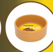
Round Plastic Water Bowl