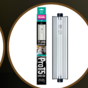
Pro T5 UVB Kit, 7% UVB ShadeDweller, 8W