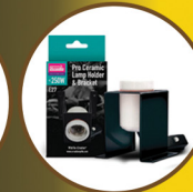
Pro Ceramic Lampholder and Bracket