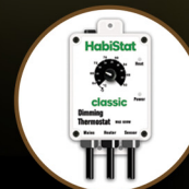
Dimming Thermostat 600W