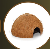
Coconut Cave x2