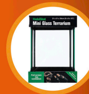
Glass Terrarium 20 x 20 x 30cm