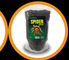
Spider Bedding, 1L