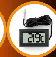
Digital Compact Thermometer