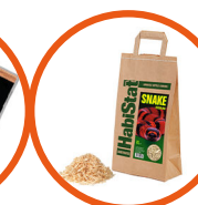
Snake Bedding* 5 Litres