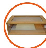
Terrainium 61 x 38 x 20cm (24 x 15 x 8")