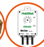
Mat Stat 300 Watt