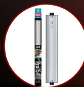
Pro T5 UVB Kit 6% UVB, 24W