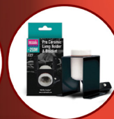
Ceramic Lamp Holder Plus Bracket Pro