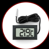
Digital Compact Thermometer