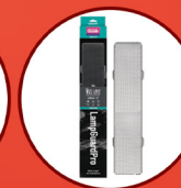
Lamp Guard Pro