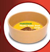
Round Plastic Water Bowl