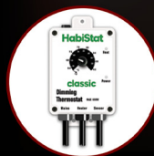
Dimming Thermostat 600W