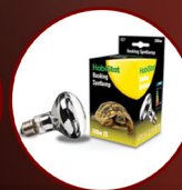
Basking Spotlamp 100W