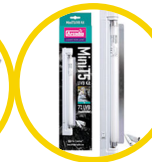
Mini UVB Kit, 7%UVB ShadeDweller Lamp, 8W