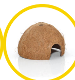
Coconut Cave x 2