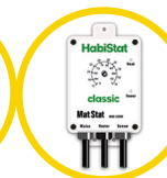
Mat Stat 300 Watt