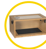
Terrainium 61 x 38 x 30cm (24 x 15 x 12")