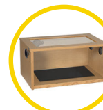
Terrainium 61 x 38 x 30cm (24 x 15 x 12")