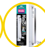
Mini UVB Kit, 7%UVB ShadeDweller Lamp, 8W