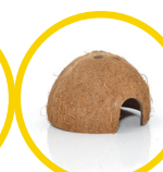
Coconut Cave x 2