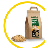
Leopard Gecko Bedding 5 kg