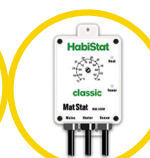
Mat Stat 300 Watt