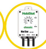
Mat Stat 300 Watt