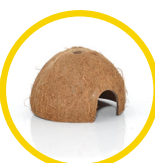
Coconut Cave x 2