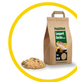
Leopard Gecko Bedding 5 kg