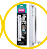
Mini UVB Kit, 7%UVB ShadeDweller Lamp, 8W