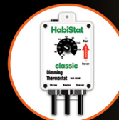
Dimming Thermostat, High Range, 600W