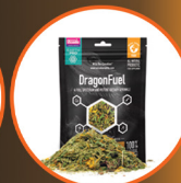
Earth Pro Dragon Fuel