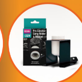
Pro Ceramic Lampholder and Bracket