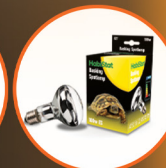
Basking Spotlamp 100W