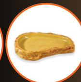
Sandstone Feeding Dish