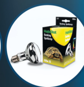
Basking Spotlamp 100W