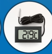
Digital Compact Thermometer