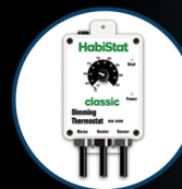
Dimming Thermostat 600W