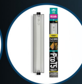
Pro T5 UVB Kit, ShadeDweller Arboreal 2.4%