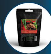
Crested Gecko Diet