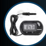
Digital Compact Thermometer