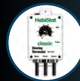
Dimming Thermostat 600W