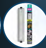
Pro T5 UVB Kit, ShadeDweller Arboreal 2.4%