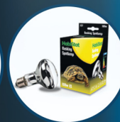
Basking Spotlamp 100W