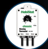
Dimming Thermostat 600W