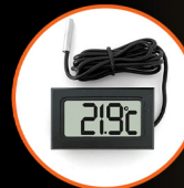
Digital Compact Thermometers x 2