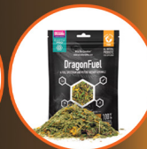
Earth Pro Dragon Fuel