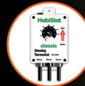
Dimming Thermostat, High Range, 600W