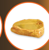
Sandstone Water Dish