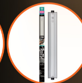
Pro T5 UVB Kit, Desert, 12% UVB, 39W