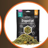
Earth Pro Dragon Fuel