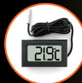
Digital Compact Thermometers x 2