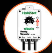
Dimming Thermostat, High Range, 600W