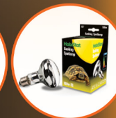
Basking Spotlamp 100W