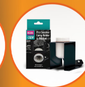
Pro Ceramic Lampholder and Bracket